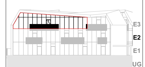
Ansicht Süd Haus A

-Bepflanzung, Möbel und Ausstattung sind symbolisch dargestellt und in der B+A detailliert beschrieben -Flächenangaben können ± 3% abweichen