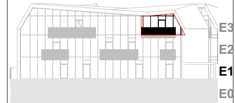
Ansicht Süd Haupt

-Bepflanzung, Möbel und Ausstattung sind symbolisch dargestellt und in der B+A detailliert beschrieben -Flächenangaben können ± 3% abweichen