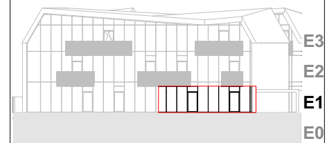
Ansicht Süd Haupt

-Bepflanzung, Möbel und Ausstattung sind symbolisch dargestellt und in der B+A detailliert beschrieben -Flächenangaben können ± 3% abweichen